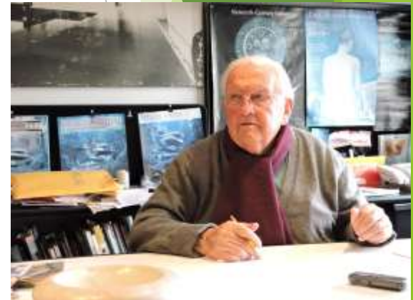
PLAN GALLINAL - DIESTE DE ESCUELAS RURALES EN FLORIDA